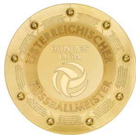
Admiral Bundesliga Fotografie