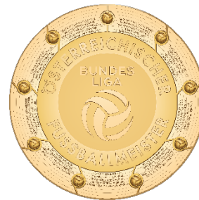
Admiral Bundesliga Illustration detailliert