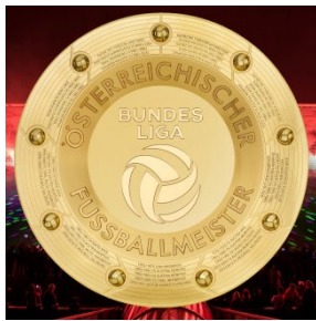
Kein unruhiger Hintergrund