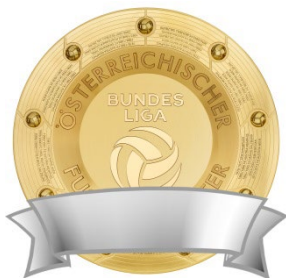
Keine zusätzlichen Elemente