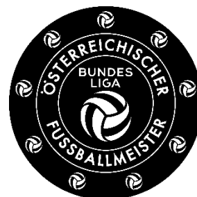
Admiral Bundesliga Piktogramm