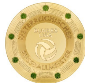
Keine illustrativen Zusatzeffekte